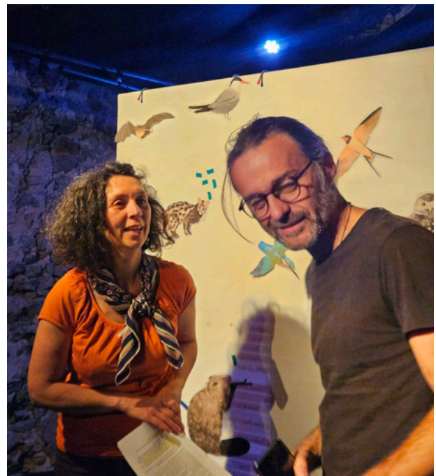
résidence de travail – mai 2025 Théâtre de l'Èvre