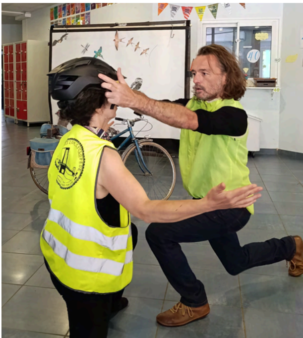
résidence de travail – juin 2025 Collège Anjou Bretagne